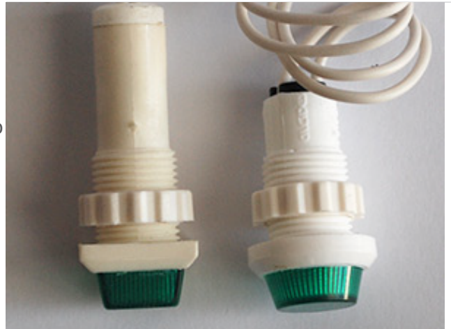
Ojo de Buey cuadrado sin aro fijación a rosca